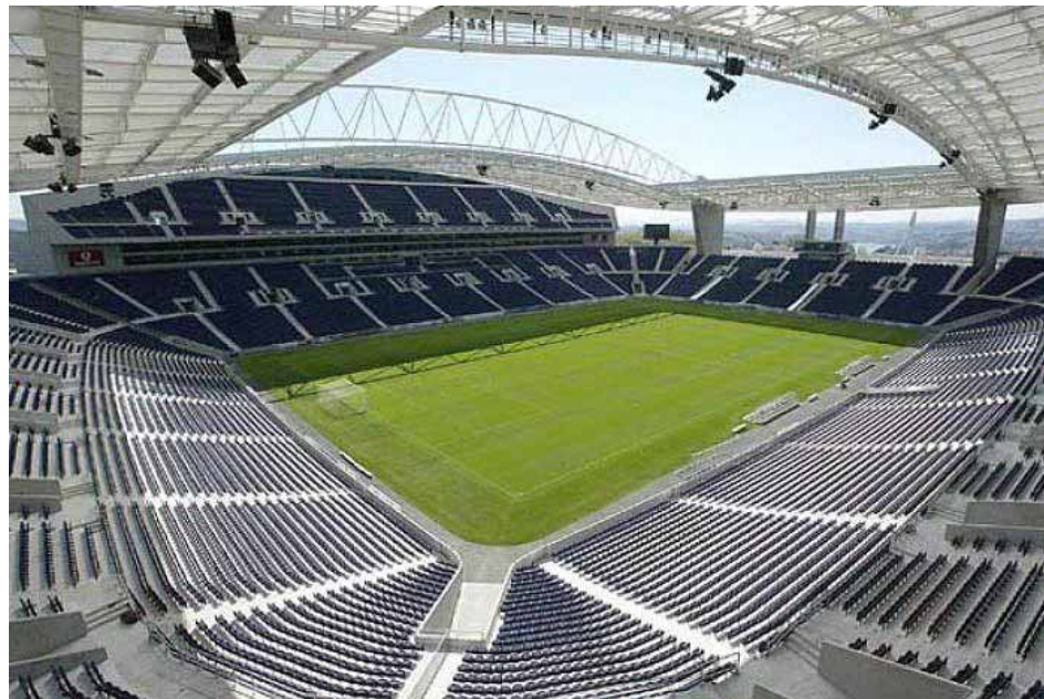
Estadio Monumental de Maturín

“Cuenten conmigo y con toda la Conmebol como aliados en este proceso de transformación del fútbol venezolano”, expresó.