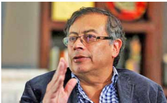
“La idea es producir fertilizantes”, dijo Gustavo Petro

T/ Redacción CO-Portal El Frente