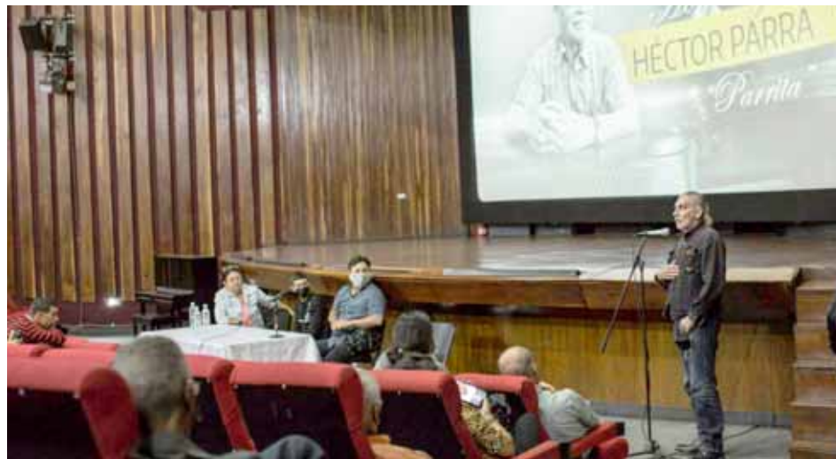
Varios directores lo buscaban para supervisar el estreno de sus películas