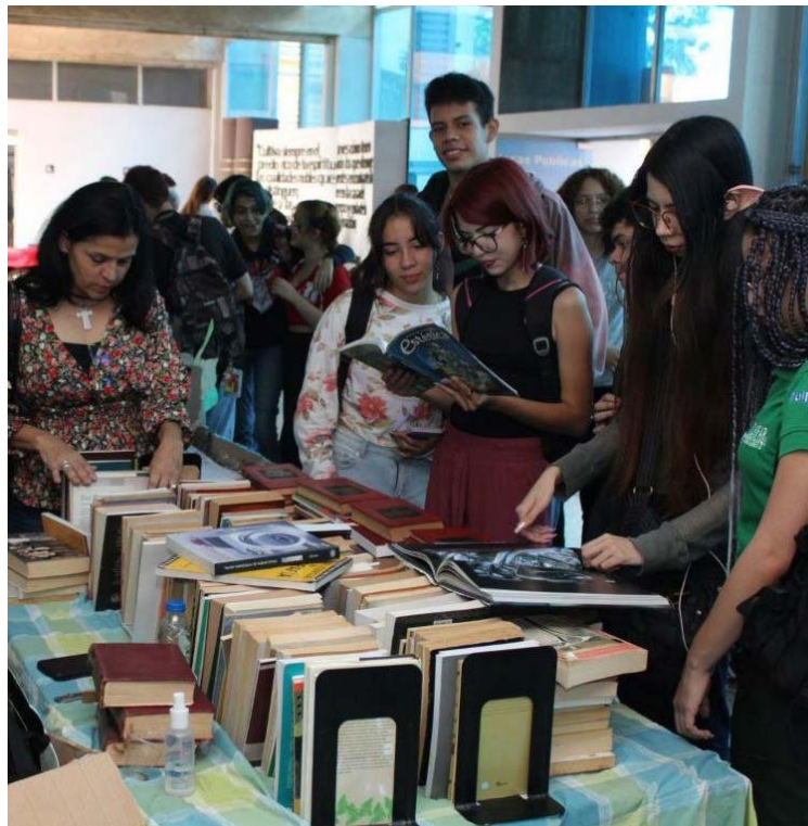
Leer es abrirse a otros mundos

Monte Ávila Editores publicará Con voz de animal pequeño , de Cósimo Mandrillo, obra ganadora de la VII Bienal Nacional de Literatura Gustavo Pereira. Asimismo, se unirá a nuestro catálogo Ocupación