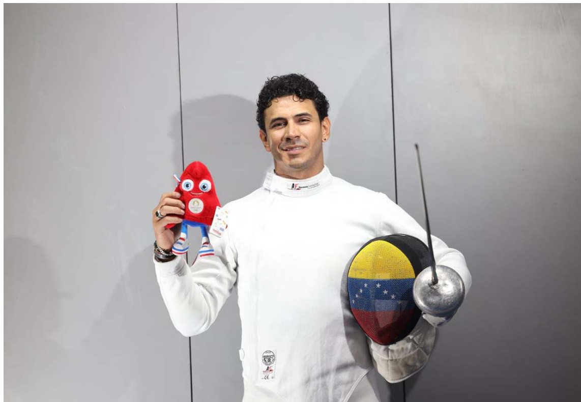
Rubén Limardo está en sus quintos Olímpicos

El campeón olímpico en Londres 2012 acaba de tomar un golpe de motivación más: “Estar con la familia luego de dos meses y medio sin verla, con mis hijos. Mi hija cumplió años. Cargarse de esa energía, algo que no pudimos hacer anteriormente. Estoy muy tranquilo. No sé qué vaya a pasar días antes de la competen-