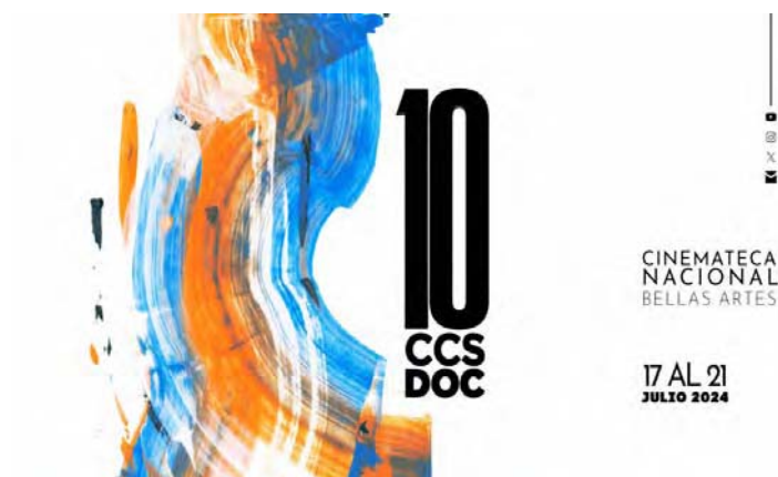
La competencia principal en esta oportunidad incluye tres largos y siete cortos

Las secciones competitivas se dividen en tres categorías: largometrajes, cortometrajes y micrometrajes, con las dos primeras como la competencia principal. Este 2024 contará con tres largos y siete cortos,