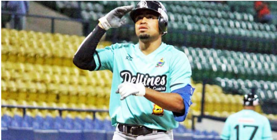
Lewis siempre tiene a su padre como norte

El utility de Delfines de La Guaira acumuló 129 puntos en la votación