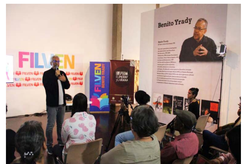
Los participantes trabajaron en equipo en torno a textos poéticos emblemáticos

Este taller es “una especie de tributo y reconocimiento a lo que nos ocurre a nosotros, los adultos, cuando escuchamos las letras de reguetón. Nos hace indagar sobre qué están leyendo nuestros niños, así no sean textos escritos”, aclaró