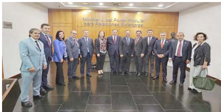
Los veedores turcos conocieron las bondades del sistema electoral venezolano y garantías que ofrece

T/ Redacción CO- Mppre