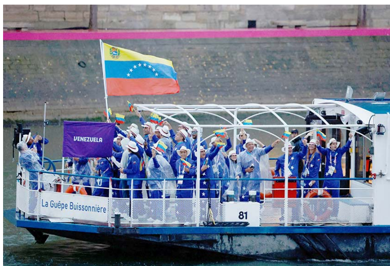
Nuestros compatriotas mostraron esa alegría que nos caracteriza

De entrada, el río Sena, que atraviesa la denominada Ciudad de la Luz, sirvió para que más de diez mil atletas de 200 y pico de naciones desfilaran montados en noventa embarcaciones, enarbolando alegres y orgullosos los pabellones nacionales de sus respectivos países.