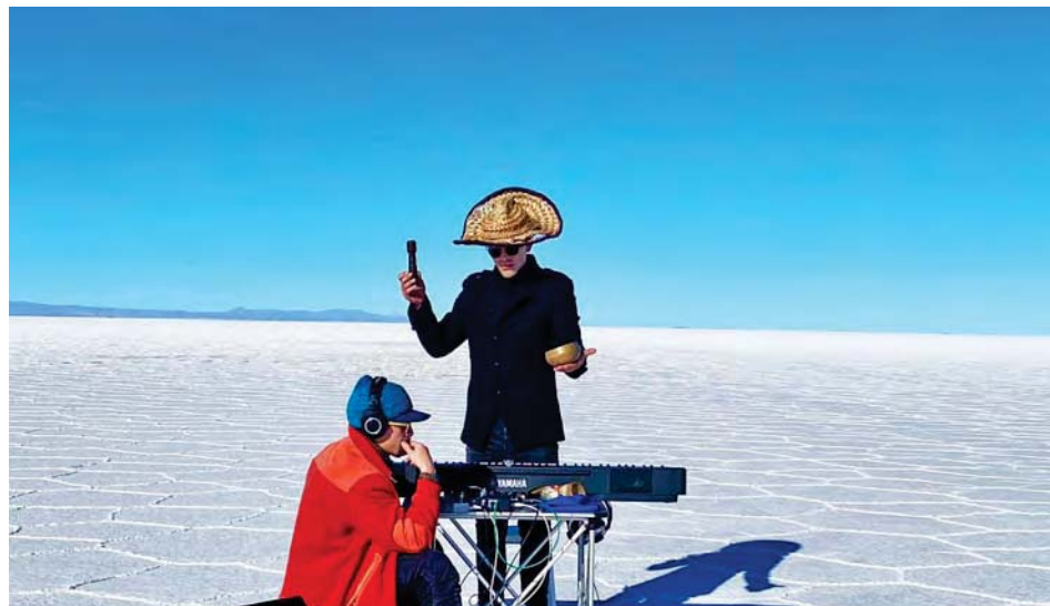
Parte de su viaje se plasmó en la obra sinfónica Sonidos del sur

Este evento es parte de la conclusión de una trayectoria de siete años de gira por ocho países, con las ofrendas musicales, acciones artísticas e hilo conductor, por lo que el repertorio preparado para la ocasión es una compilación de todas sus ofrendas anteriores, caracterizadas por la fusiones y diversidad sonora.