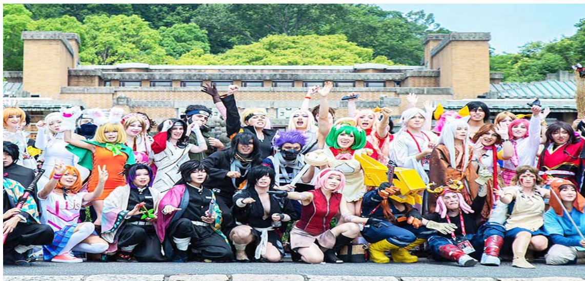
Esta tendencia se ha convertido en un elemento dinamizador de la economía