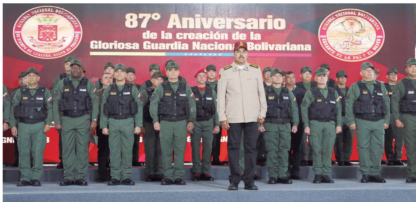
págs. 4, 5 y 16

chazó además el discurso de la Unión Europea, que habla de manifestaciones pacíficas en el país. Destacó que más de un 92 por ciento de las venezolanas y los venezolanos repudian enérgicamente los brotes de violencia.