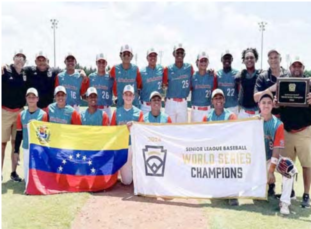
Un merecido triunfo al quedar invicta en la justa

La alegría desbordante en el equipo venezolano es palpable, pues este título mundial llega después de 28 años de espera, consolidando así la tradición