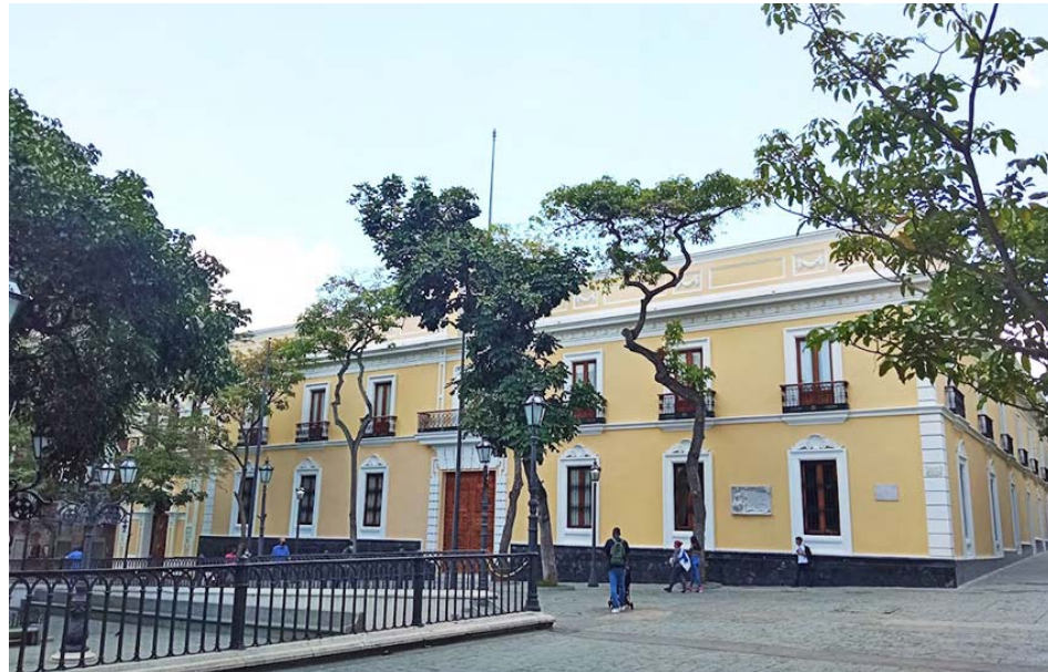
Casa Amarilla, sede de la Cancillería venezolana

A través de X, Gil aseguró que la MOE “es una estafa más” que pretende utilizar los mismos datos sobre las presuntas actas electorales que hizo pública la Plataforma Unitaria, las cuales están plagadas de graves irregularidades.