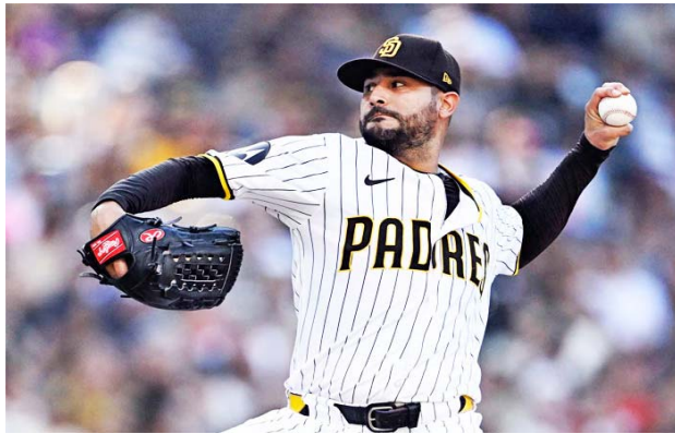
El de Las Matas promedió su recta a 92-2 millas por hora

De paso, se convirtió en el primer abridor zurdo de los curitas en 2024, tras 112 encuentros. De acuerdo con Elias Sport Bureau, la anterior temporada de San Diego en la que transcurrieron más juegos antes de ver a un zurdo iniciando fue en 2015 (148 partidos).