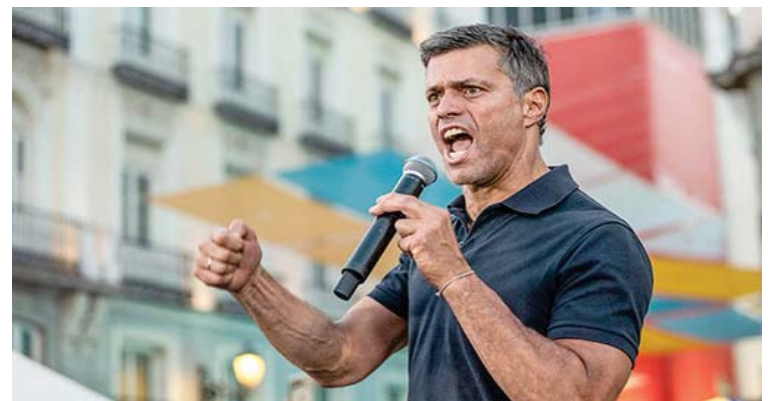
El líder opositor venezolano, Leopoldo López durante una manifestación en Madrid, el 3 de agosto de 2024.

La congregación en la capital española fue convocada en el contexto de la movilización organizada en Caracas por la exdiputada María Corina Machado para manifestar el apoyo a Edmundo González, quien