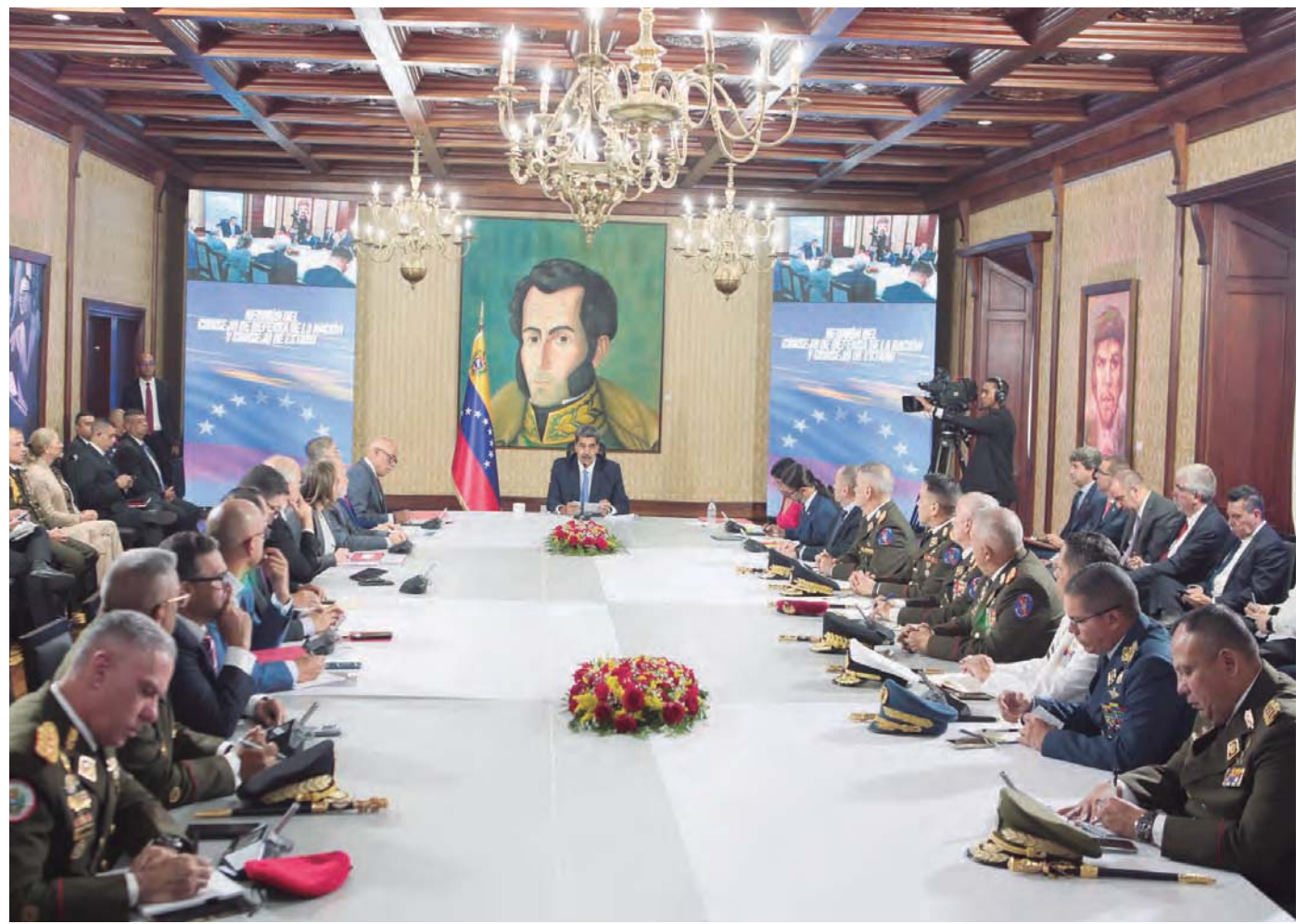
págs. 4 y 5

formes del fiscal general de la República, la vicepresidente ejecutiva, la ministra de Ciencia y Tecnología y el Presidente de la Asamblea Nacional. El Jefe del Estado venezolano decretó la creación del Consejo Nacional de Ciberseguridad para enfrentar ataques cibernéticos.