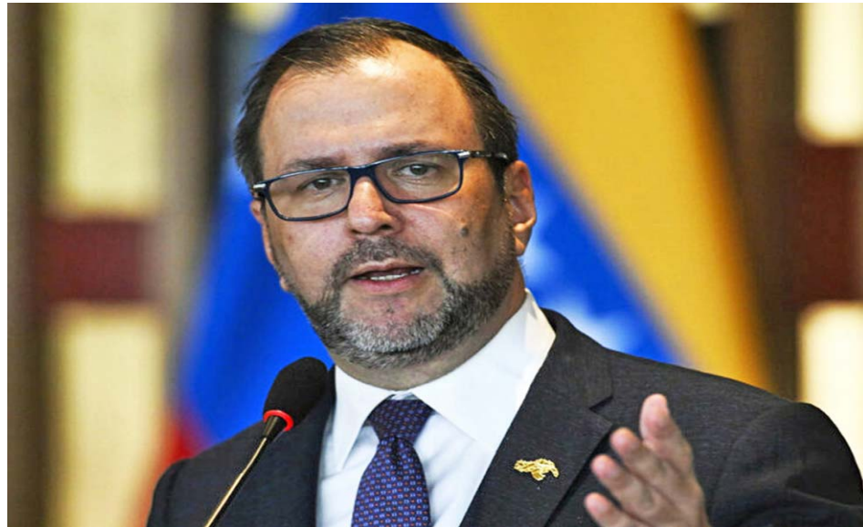
La verdad siempre prevalece, a pesar de los embates del imperialismo

“El país sufrió un ataque cibernético masivo, hecho que oculta “el fascismo y los medios internacionales”, reiteró el canciller de Venezuela, Yván Gil, quien destacó que pese a ello “la verdad siempre prevalece”.