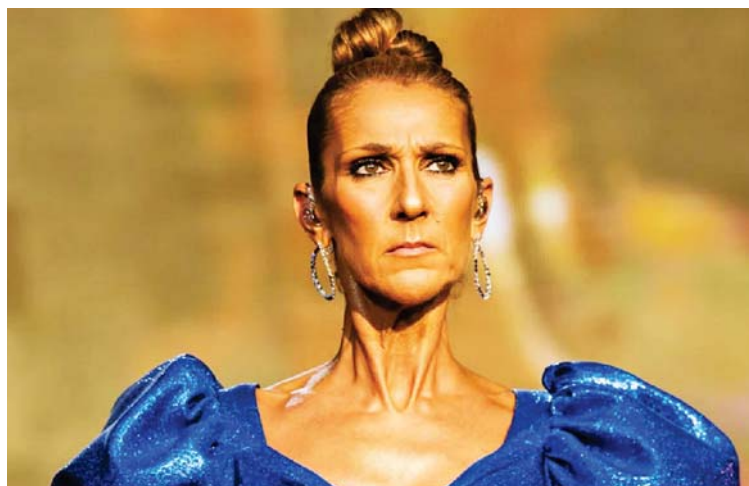
La artista repitió el rechazo que también manifestaron Aerosmith y Pharrell Williams

El viernes pasado, “el equipo de gestión de Céline Dion y su sello discográfico, Sony Music Entertainment Canada Inc., se enteraron del uso no autorizado del video, la grabación, la interpretación musical y la imagen de Céline Dion cantando ‘My heart will go on’ en un mitin de