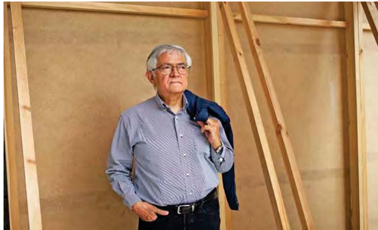
Ha escrito tres libros sobre aforismos y arte

El paso del tiempo fue desgastando la relación del autor con el objeto. Toda vez que se enfrentaba a la obra se iba despojando de esas capas que ahora le resultaban algo rígidas, capas de ropas de las que se fue despojando entre el invierno y el verano, hasta quedar desnudo frente al arte, y esa fue su ganancia