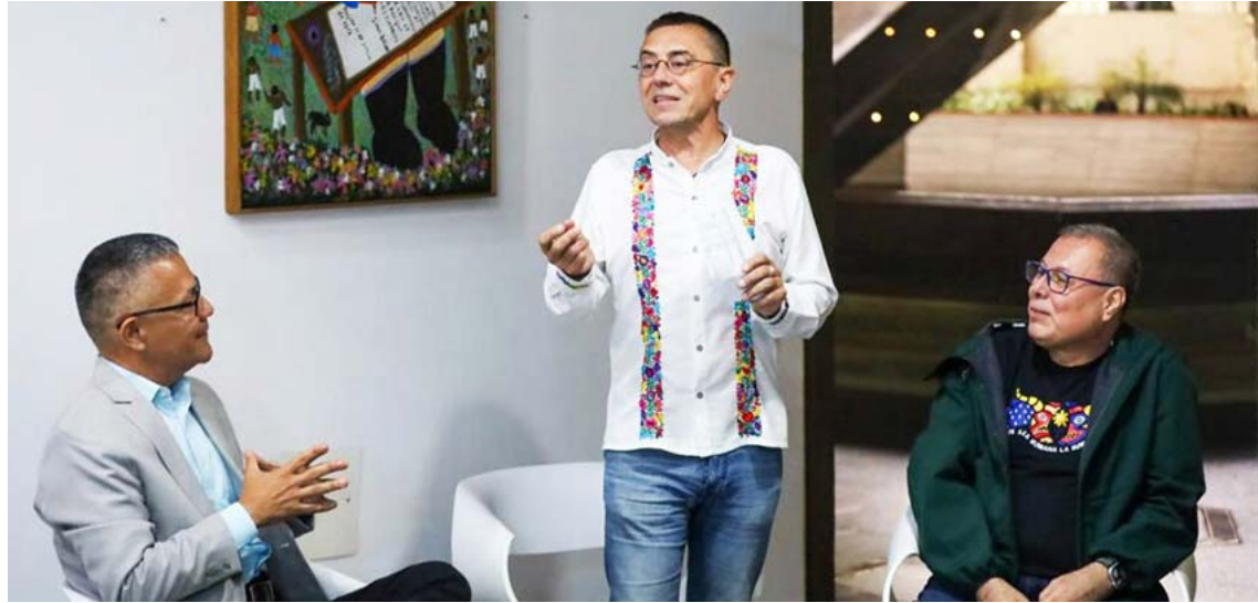
La reunión aportó muchas propuestas

“En Venezuela los libros llenan salas, este libro es un verdadero acto de valentía al dedicarle 20 años al pensamiento y a la