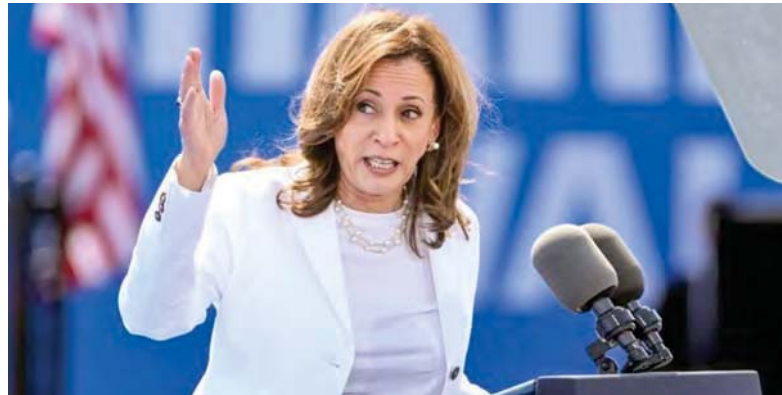
Candidata por el partido demócrata, Kamala Harris

“Uno no puede decir que tiene una regla para Facebook y una regla diferente para Twitter”, señaló a vicepresidenta de Estados Unidos y candidata presidencial por el partido Demócrata