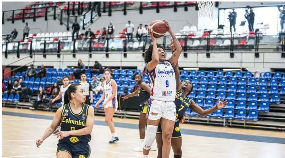
Las Vinotinto deben mejorar en el ataque