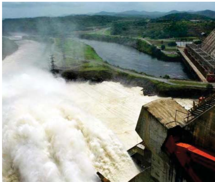
La central hidroeléctrica de Guri provee más de 63% de la energía eléctrica de Venezuela