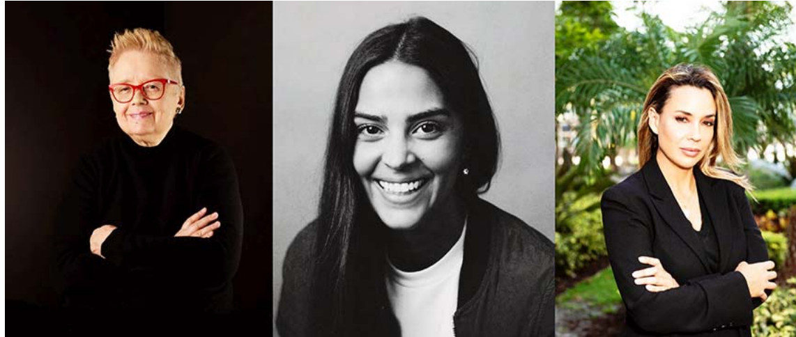
Tres experimentadas damas son las encargadas de evaluar las propuestas postuladas

Los ganadores del certamen formarán parte de una muestra que se podrá apreciar, de manera gratuita, desde cualquier parte del mundo en el que haya internet, en un espacio digital. La intención es mostrar las inquietudes que plasman en sus trabajos los creadores visuales emergentes