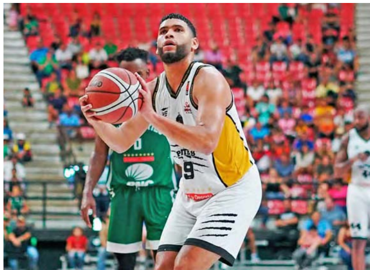
El petareño trabaja en fortalecer el físico

Desde su estreno como profesional en el año 2021, las expectativas generadas en el entorno del “Ciclón de Petare” han sido altas. Las sensaciones que arrojó por su osadía de cara al canasto, sus habilidades con la mano izquierda y su energía en el costado defensivo fueron positivas, aunque no fue hasta esta Superliga Profesional de Baloncesto (SPB) 2024 cuando de verdad se empezó a notar toda su calidad, sobre todo en la segunda mitad del torneo.