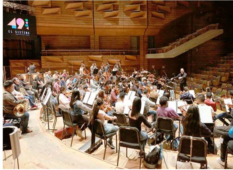
El registro fue realizado por la Orquesta Sinfónica Simón Bolívar

Según resalta una nota de prensa, la producción postulada al mencionado galardón se grabó, en su totalidad, en el Centro Nacional de Acción Social por la Música, ubicado en la localidad caraqueña de Quebrada Honda,