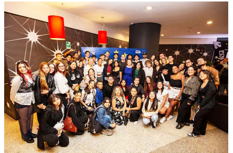
El certamen abarca diversas temáticas

Como parte de la actividad se proyectó un video resumen de la experiencia de Cortoscopio en diferentes estados del país donde hubo exhibiciones de los cortos seleccionados, como fueron Carabobo, Bolívar, Lara, Mérida, Nueva Esparta y Zulia.