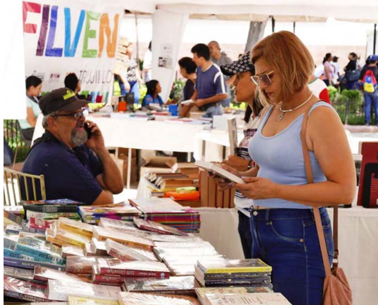
El principal evento literario del país continúa su recorrido por el país