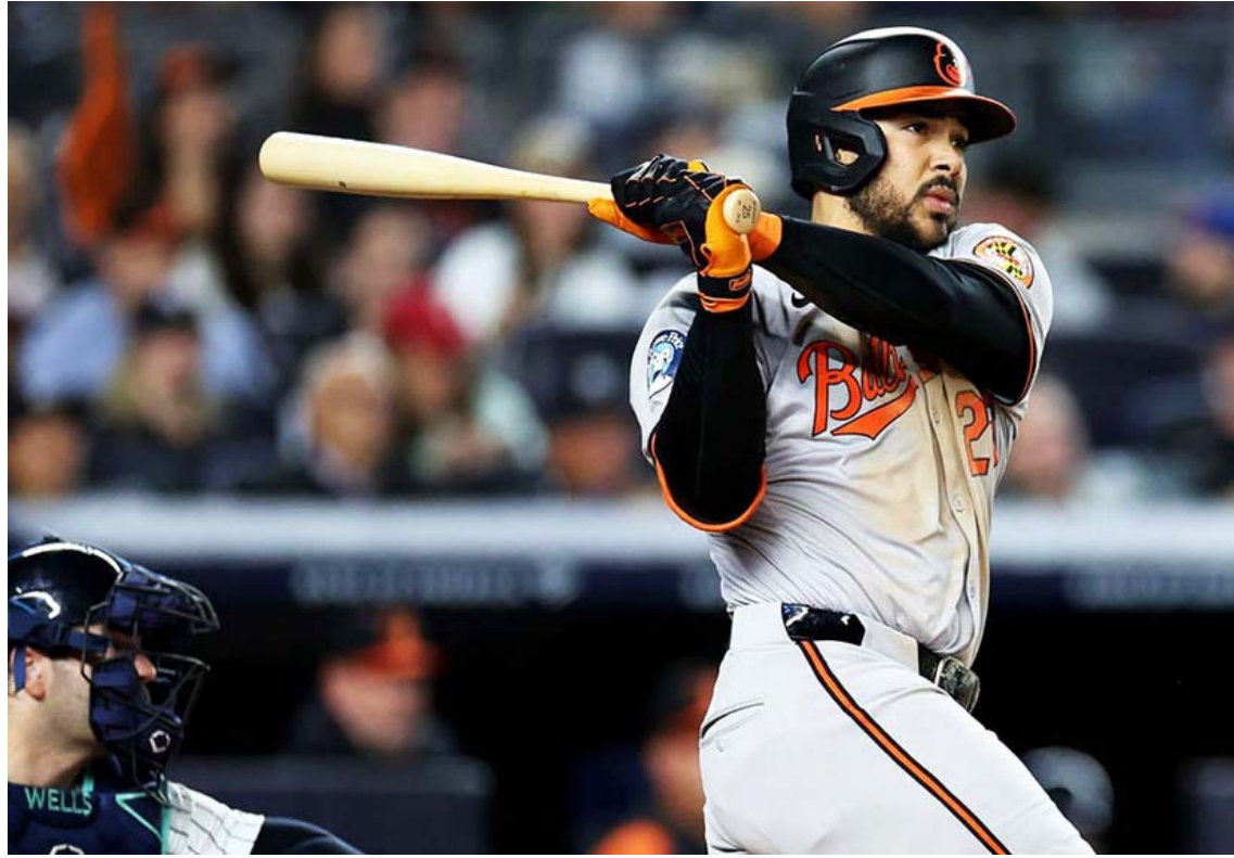
Santander tiene números para llevarse el trofeo como jardinero

Entretanto, alcanzó la barrera de los 20 jonrones por sexta vez en las últimas ocho temporadas. Está compitiendo por su