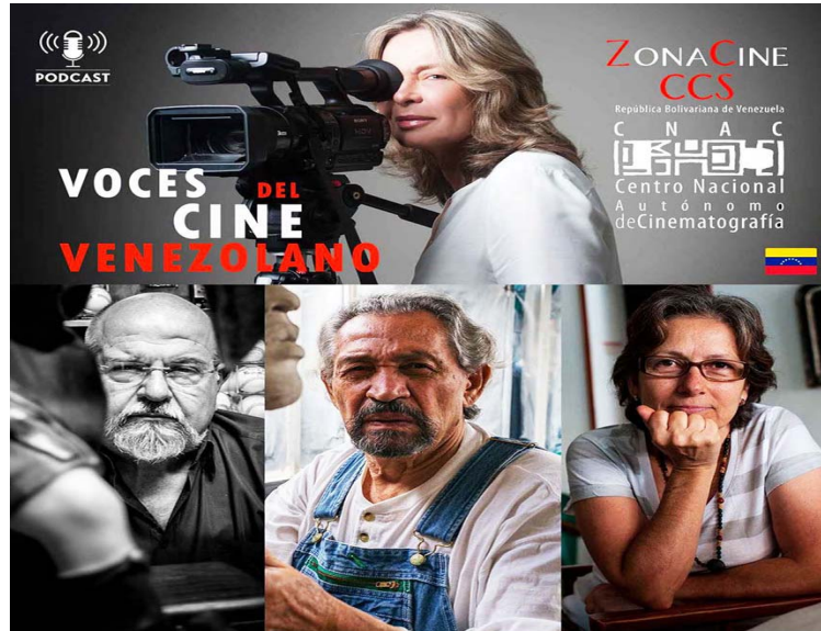
El espacio es apoyado por el CNAC

En cada entrega salen a flote historias curiosas que cada entrevistado ofrece a viva voz en