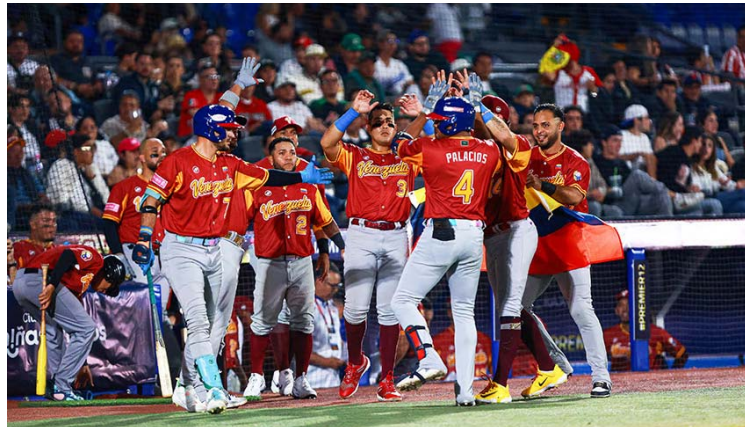
La Vinotinto está bien amalgamada

En la cita de Guadalajara, Venezuela se impuso en orden a México (8-4), perdió ante Pa-