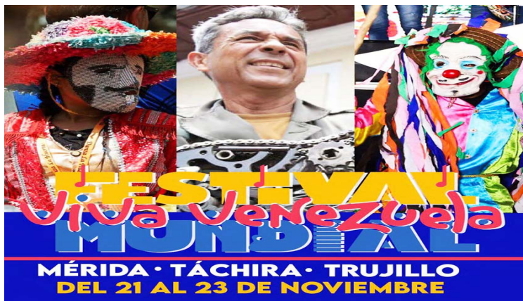
La fiesta llegará a varias localidades de la región