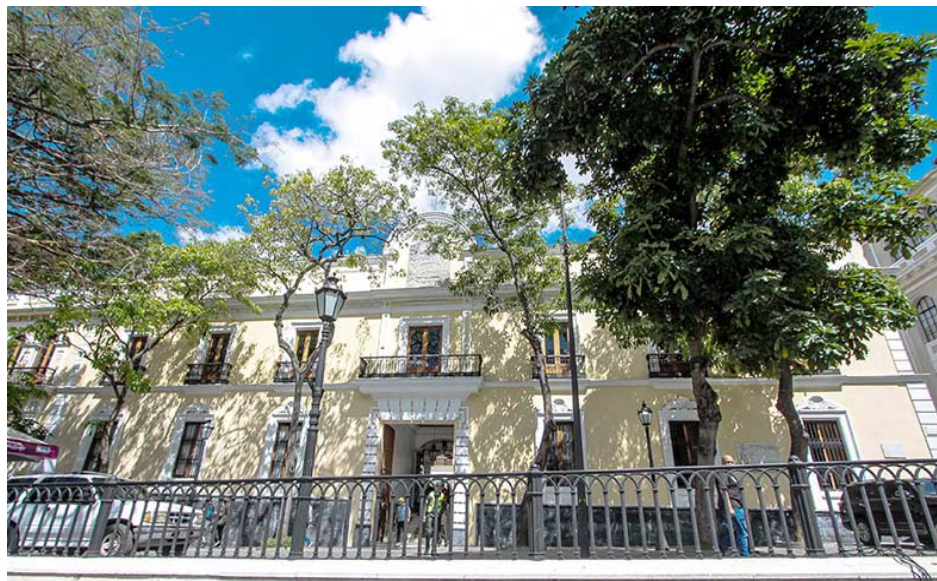
La Casa Amarilla, sede de la Cancillería venezolana

“¿Hasta dónde se puede llegar al intentar arrastrarse más allá de los límites