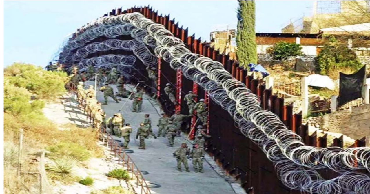
Trump anunció que completará la construcción del muro fronterizo con México

El resultado de los pasados comicios presidenciales en EEUU revela que todos ganaron. Pero en particular, dos magnates de Silicon Valley, contratistas del deep state , en particular, de los servicios de inteligencia: Elon Musk, el hombre más rico del planeta, y Peter Thiel (Palantir)