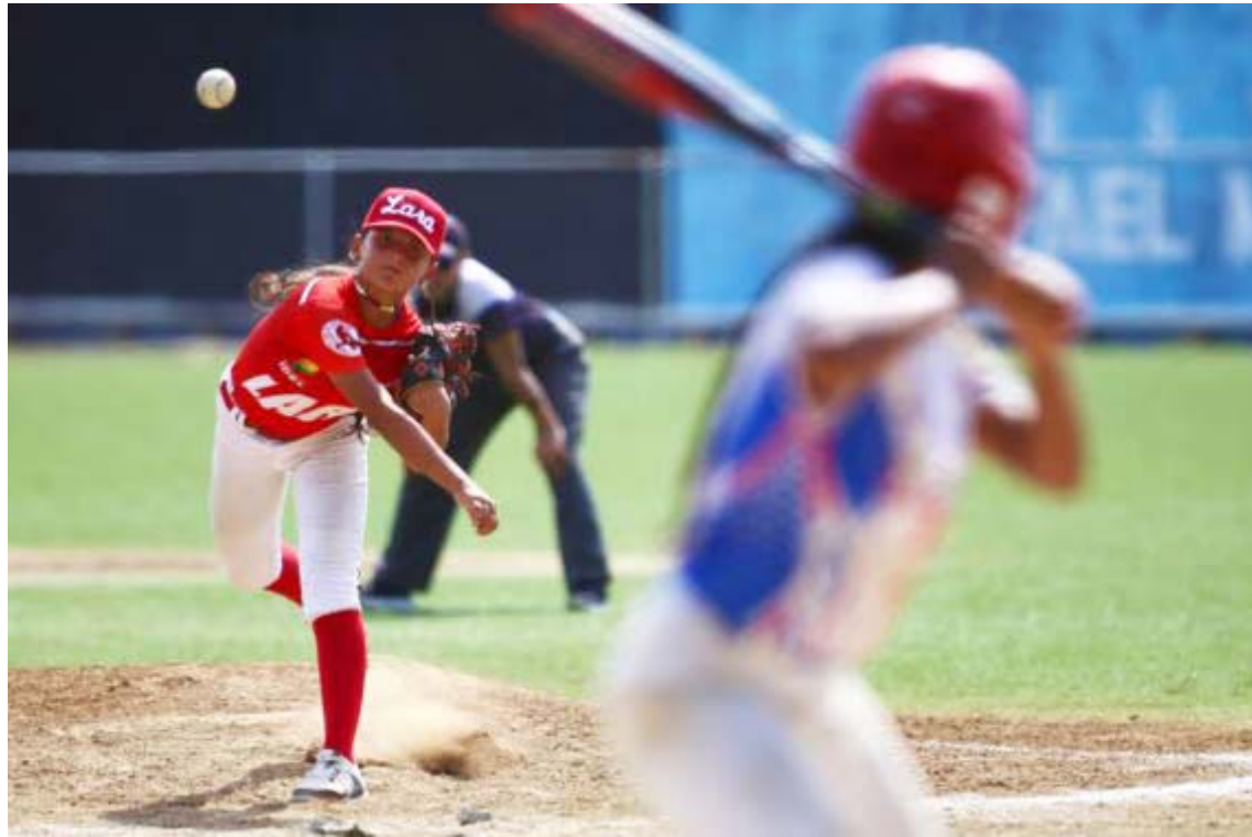
El pitcheo fue clave para las muchachas crepusculares

Durante la última jornada, se disputaron los combates por equipo de florete masculino, donde Distrito Capital se alzó con el oro tras vencer al conjun-