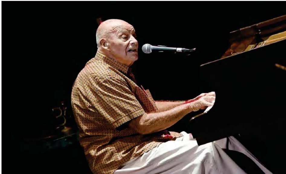
Una legión de alumnos y amigos dejó este austríaco más venezolano que muchos

A los 85 años partió “el Maestro del jazz venezolano”