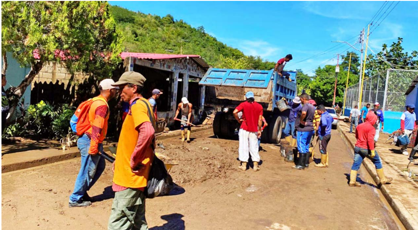
Labores de limpieza en el estado Sucre

El Comité de Gestión de Riesgos de Mérida se mantiene en permanente vigilancia ante la persistencia de las lluvias, y los daños provocados. Mas de 100 viviendas fueron afectadas como consecuencia del desbordamiento de los ríos Cachamaure y Tarabacoa