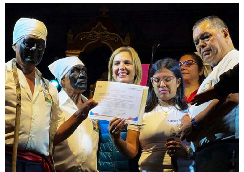
La manifestación se ha mantenido por más de 400 años

Seguidamente, leyó el texto del certificado donde refiere que Los Negros de San Jerónimo son una “ceremonia, fiesta y ritual de raíces ancestrales y sincréticas, practicada desde hace 405 años de forma ininterrumpida en la localidad del Baho en el Bajo del llano del Moruco, parroquia Santo Domingo. Sus devotos y devotas se congregan para dar gracias al