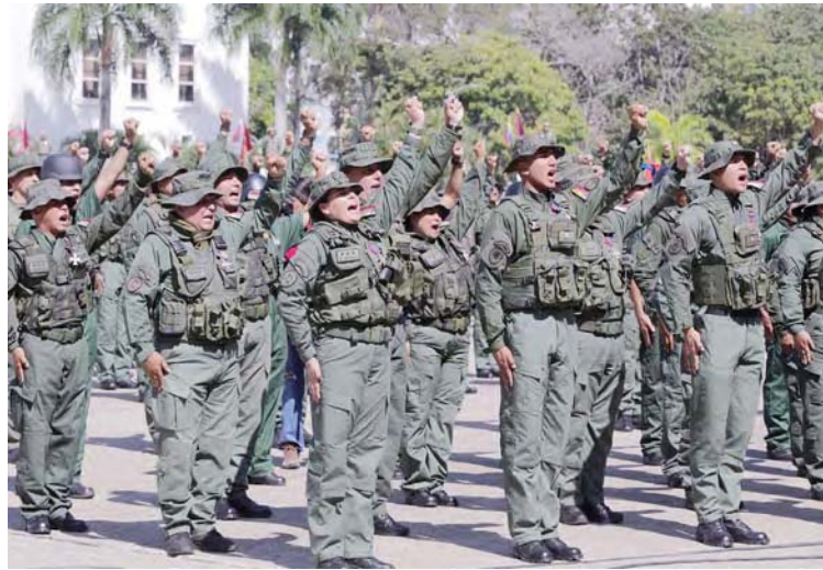
“Los enemigos de Venezuela se van a encontrar con la mayor fortaleza que tenemos que es la unidad”, dijo el ministro Diosdado Cabello

La actividad tuvo lugar en la Universidad Militar Bolivariana de Venezuela, donde las autoridades hicieron entrega