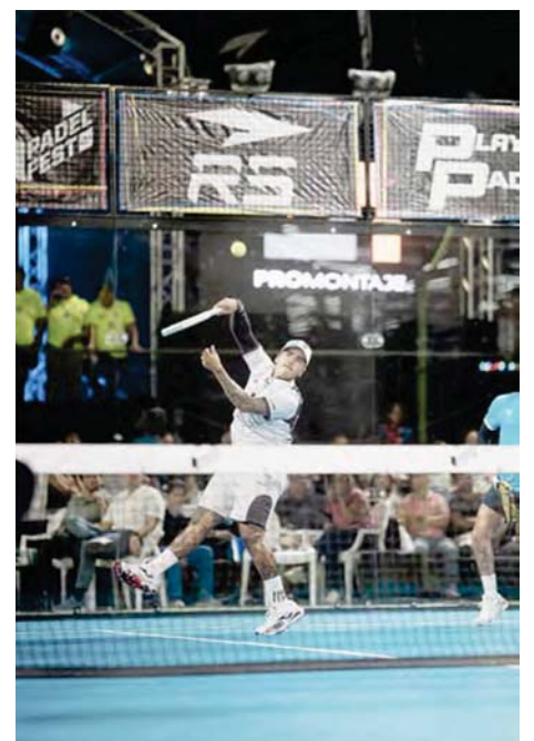
Es un deporte que está en crecimiento