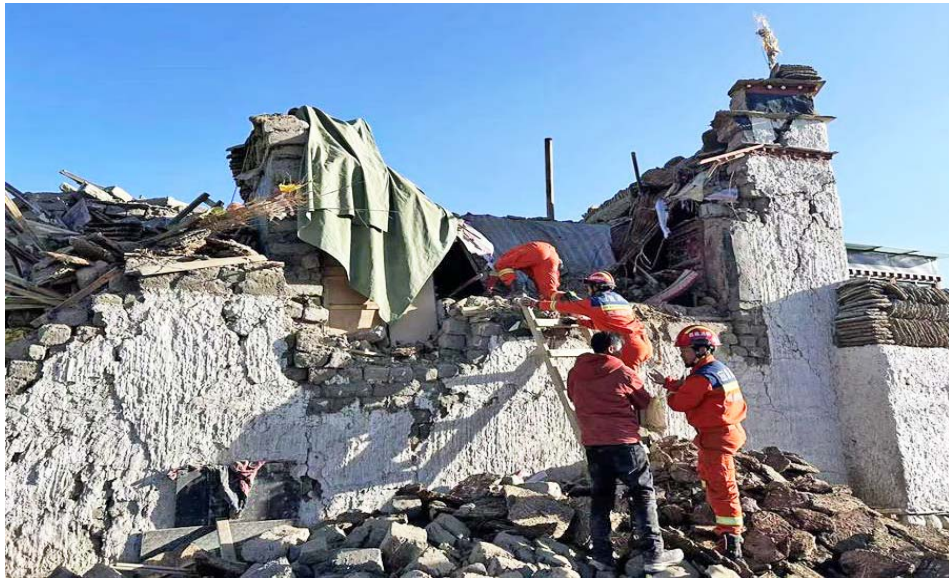
Más de 1.000 viviendas sufrieron daños a causa del sismo

El Ejecutivo Nacional extendió su disposición de brindar apoyo en las áreas que sean necesarias