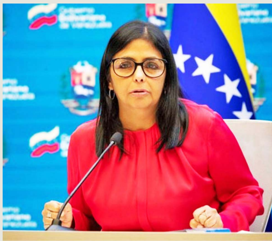
La vicepresidenta Delcy Rodríguez prevé consolidar las capacidades contraloras