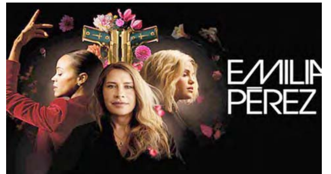
La cinta Emilia Pérez , del francés Jacques Audiard, competirá en 15 nominaciones

El épico regreso de Ridley Scott al coliseo también se quedó fuera de la categoría de mejor director y actor principal, aunque Denzel Washington,