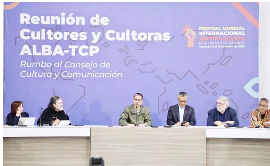
A su entender entre los objetivos del imperialismo es dividir a los pueblos

“Frente a esa corriente homogeneizadora de lo banal y lo viral, nosotros hemos salido a reafirmar nuestra identidad que