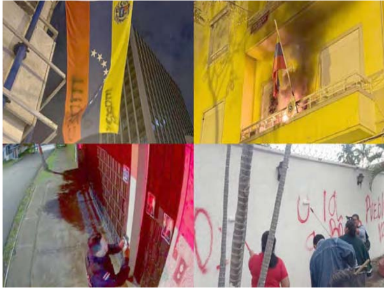
El ministro Yván Gil publicó en Instagram imágenes de las sedes diplomáticas vandalizadas

Canciller Yván Gil denunció nuevos ataques perpetrados en los consulados de Venezuela en Frankfurt, Medellín y San José de Costa Rica, “en una acción coordinada por los comanditos del fascismo desquiciado”