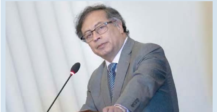
Gustavo Petro: una guerra entre venezolanos y colombianos marcaría a las nuevas generaciones