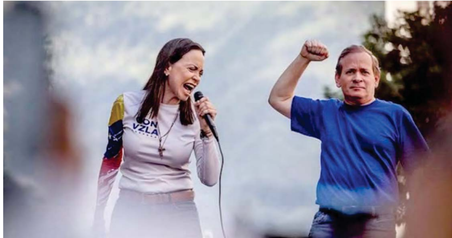
María Corina Machado junto a Juan Pablo Guanipa en una manifestación en Caracas que no llenó las expectativas. 9 de enero de 2024

Previo a la toma de posesión del presidente Nicolás Maduro para un tercer mandato, María Corina Machado y Edmundo González orquestaron una