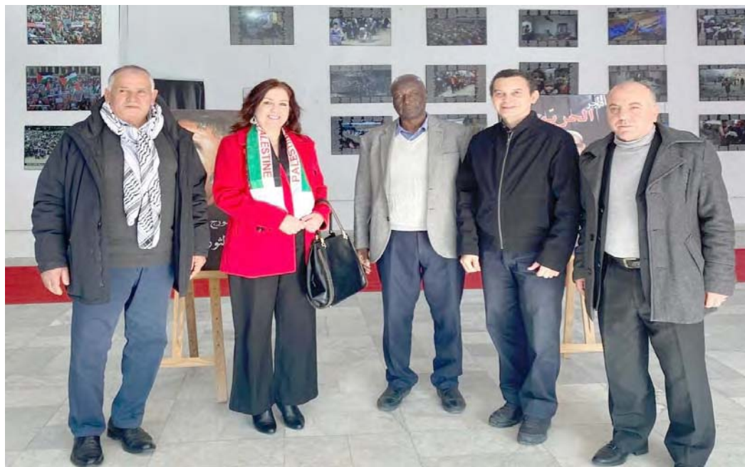
La muestra es en honor a revolucionarios, intelectuales líderes palestinos y mártires tunecinos que lucharon con Palestina

T/ Redacción CO-Prensa Mppre