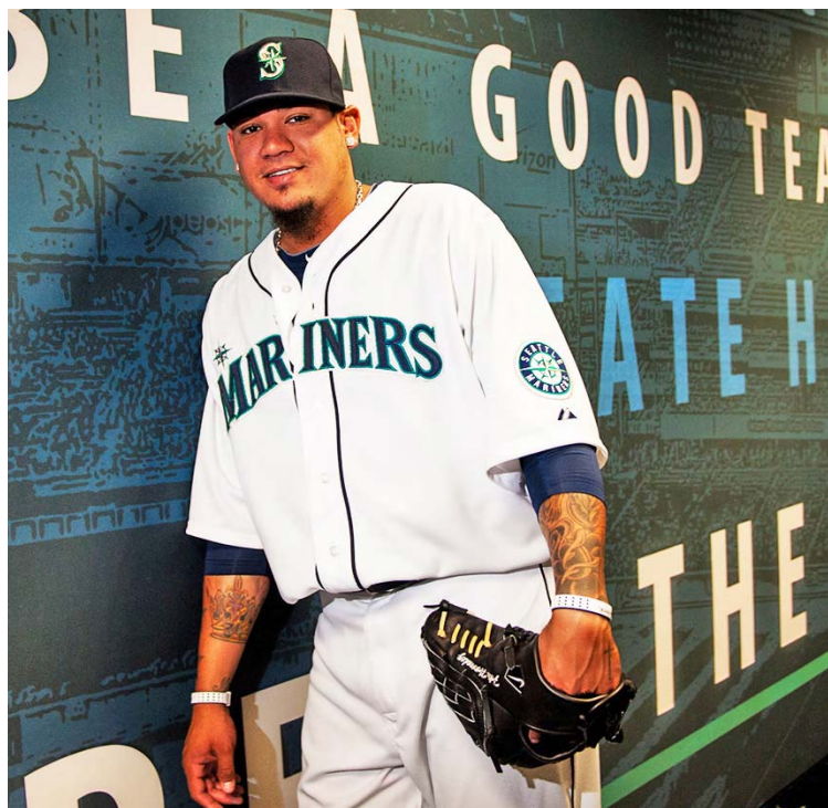
"El Rey" tuvo grandes números en su carrera de quince años

Fuera del nipón, existen otras opciones, aunque no son fijas. El segundo chance lo tiene el zurdo CC Sabathia, quien en 19 años en la MLB con Cleveland, Cerveteros y Yankees, es miembro del club de los 3.000 K