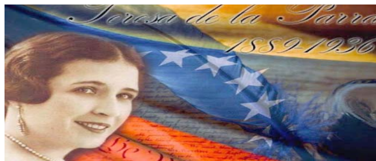
El certamen está abierto para jóvenes de entre 12 y 18 años

Este concurso convocado tiene como objetivo principal celebrar la vida y obra de una de las más insignes representantes de la literatura venezolana, cuyo legado se mantiene vigente como una influencia insoslayable en distintas generaciones de creadores literarios en el país.