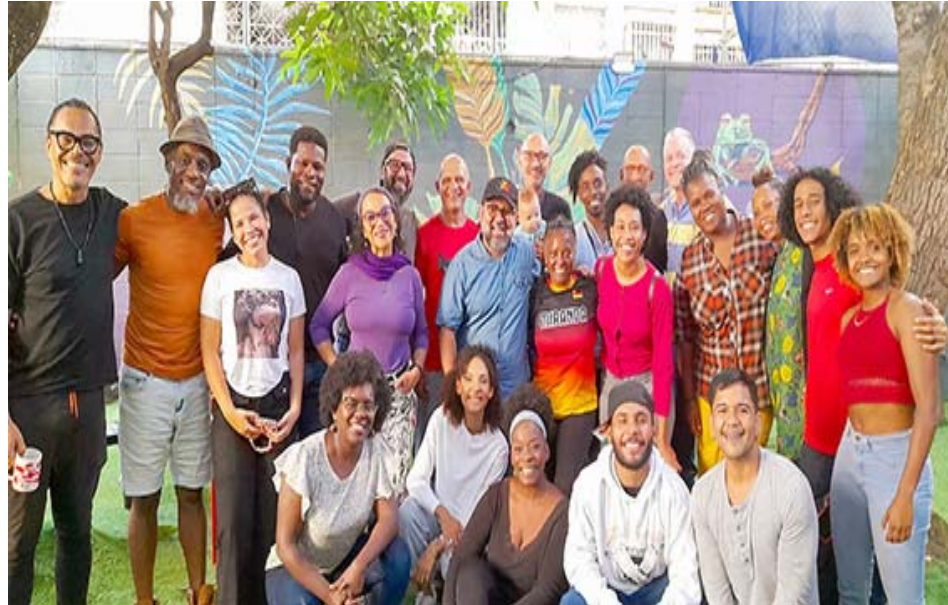
La estrella negra, de Pablo García Gámez se estrenará en el festival progresista

También, este año el público podrá disfrutar de una de las piezas de Isaac