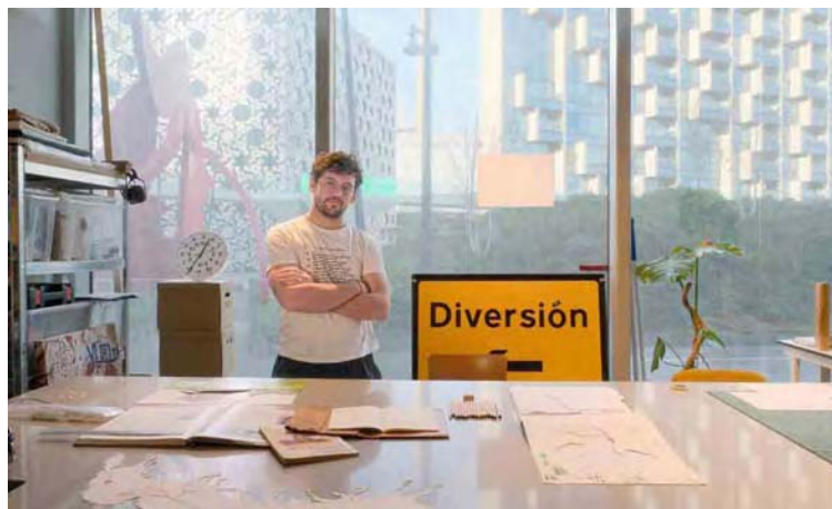
La pregunta ¿De qué color es el caballo blanco de Simón Bolívar? generó la propuesta

“¿De qué color es el caballo blanco de Simón Bolívar? Recuerdo que me lo preguntaban en el colegio. También recuerdo, como tarea, pintar el escudo a color y dejar el caballo sin re-