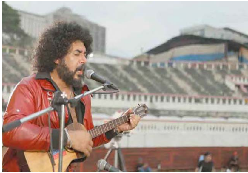
La producción se estrenó en octubre pasado en ocasión el natalicio del músico

La Fundación Cinemateca Nacional (FCN), ofrecerá una función gratuita, al aire libre, con la película Alí Primera , de Daniel Yegres, próximo miércoles 22 de enero,