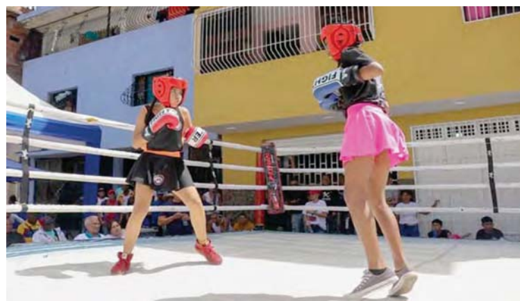
Se observó muchachos con muchas cualidades