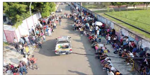
Migrantes hacen fila en una estación migratoria en el municipio de Tapachula, en el estado de Chiapas (México).