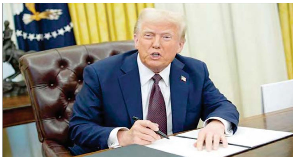
Donald Trump, firma órdenes ejecutivas en la Oficina Oval de la Casa Blanca en Washington, DC (EE.UU.).

Trump exhibe la exaltación de la xenofobia disfrazada de preocupación