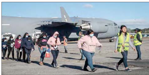
Los primeros dos vuelos de deportación del Gobierno del presidente estadounidense, Donald Trump, arribaron a Guatemala en aviones militares procedentes de Texas.