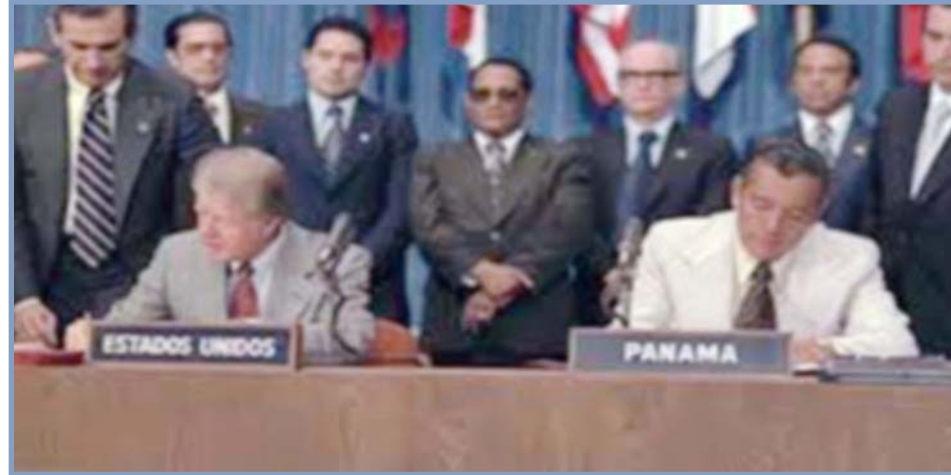
La firma de los Tratados Torrijos-Carter. Hace 43 años, el 7 de septiembre de 1977, el presidente Jimmy Carter y el presidente Omar Torrijos firmaron el acuerdo que entregaba a Panamá el control absoluto del Canal y de la zona adyacente.

Siguiendo la Doctrina Monroe, desde el siglo XIX hasta el presente, Estados Unidos ha actuado bajo la convicción de que América Latina y el Caribe son su "patio trasero" y zona exclusiva de saqueo económico y neocolonialismo político. Reiteradas invasiones, golpes de estado, sanciones económicas contra los estados que intentan zafarse (Cuba, Venezuela) así lo demuestran, especialmente durante la Guerra Fría con la Unión Soviética. Instituciones como la Organización de Estados Americanos (OEA), el Tratado Interamericano de Asistencia Recíproca (TIAR) y la Escuela de las