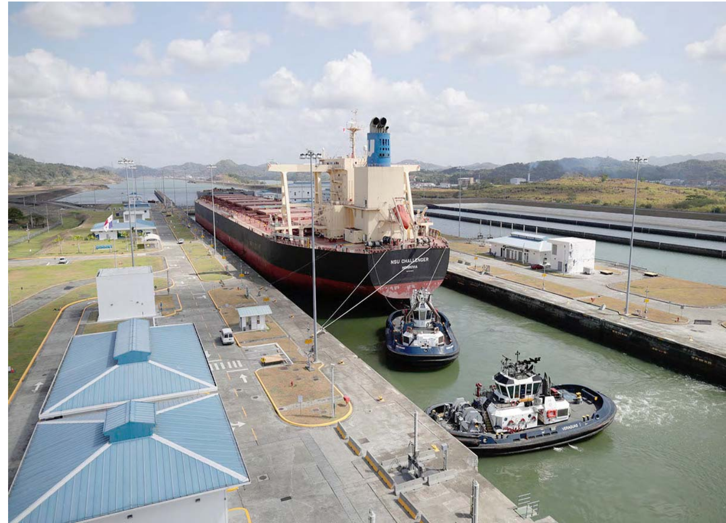
Una vista reciente del Canal.

Ellos trabajaron bajo un régimen racista estilo "apartheid", que separaba física y socialmente a los anglosajones