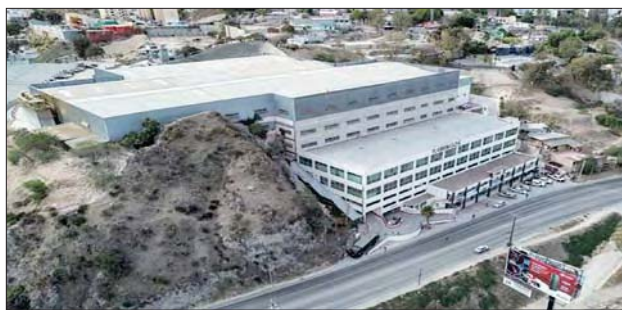
Este centro comercial en Tijuana, México, se habilitará como albergue para migrantes deportados de Estados Unidos.