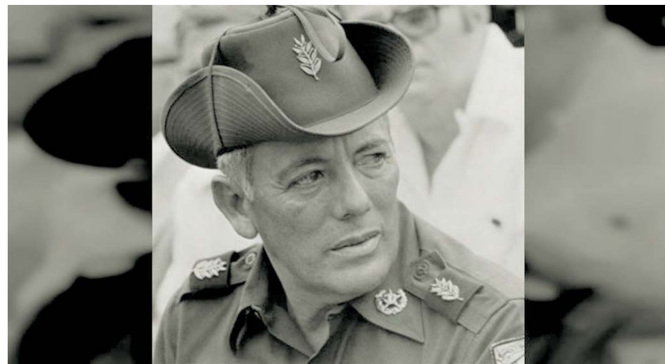
Omar Torrijos sentó las bases para la devolución total del Canal por parte de Estados Unidos que lo había controlado desde 1903 con presencia militar en Panamá.

En esas palabras está expresado el meollo del problema. La política de Trump, exterior y comercial, intenta ser una respuesta a un proceso objetivo de decadencia económica y política de Estados Unidos que cada vez más le cuesta competir con la influencia de los capita-