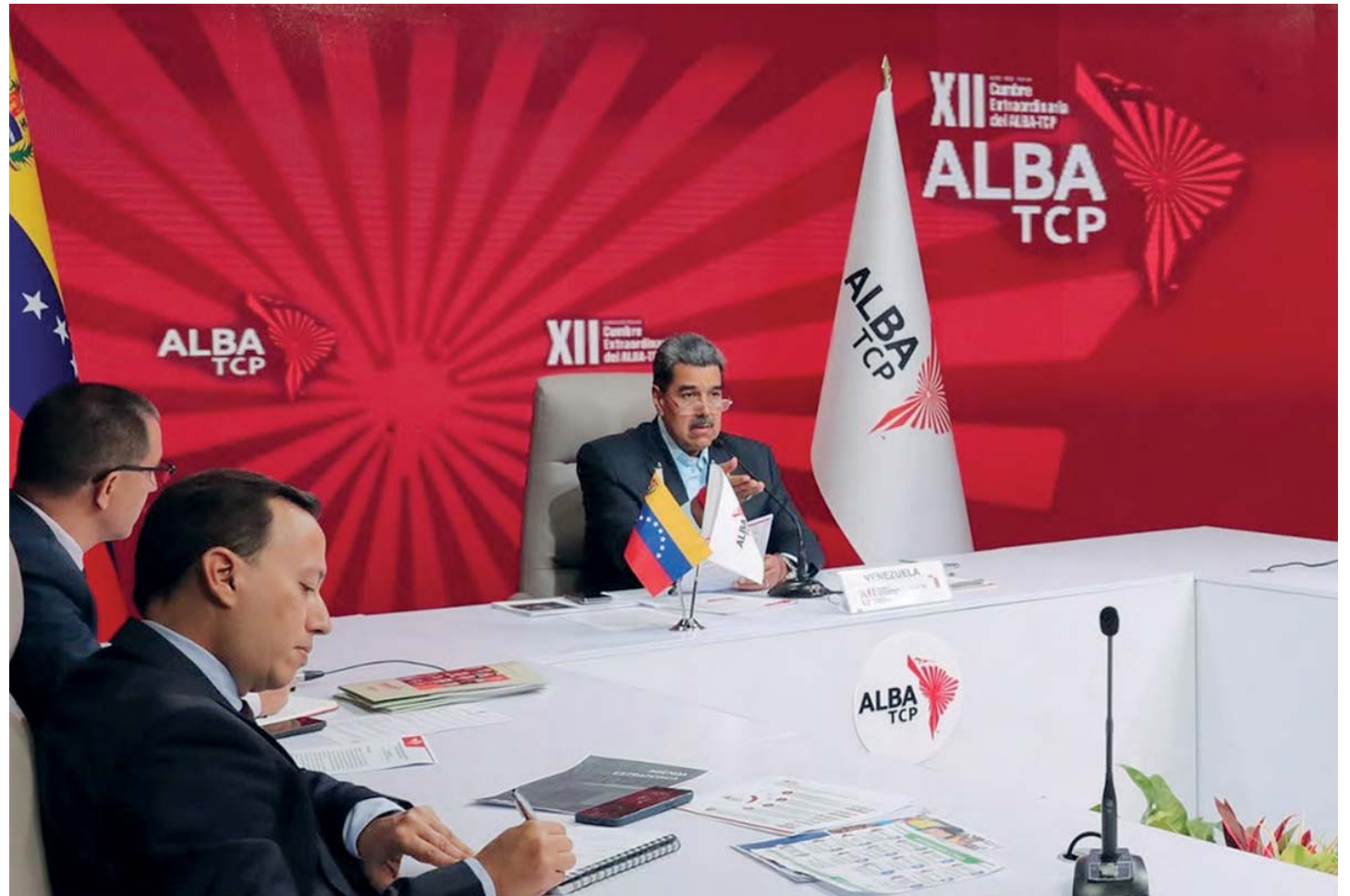
“La dignidad, desarrollo y crecimiento de la región no debe estar sometida a agentes externos” resaltó el presidente Nicolás Maduro

Inspirados por las ideas inmortales del Apóstol de Cuba, José Martí, en su certeza sobre el respeto que debemos exigir