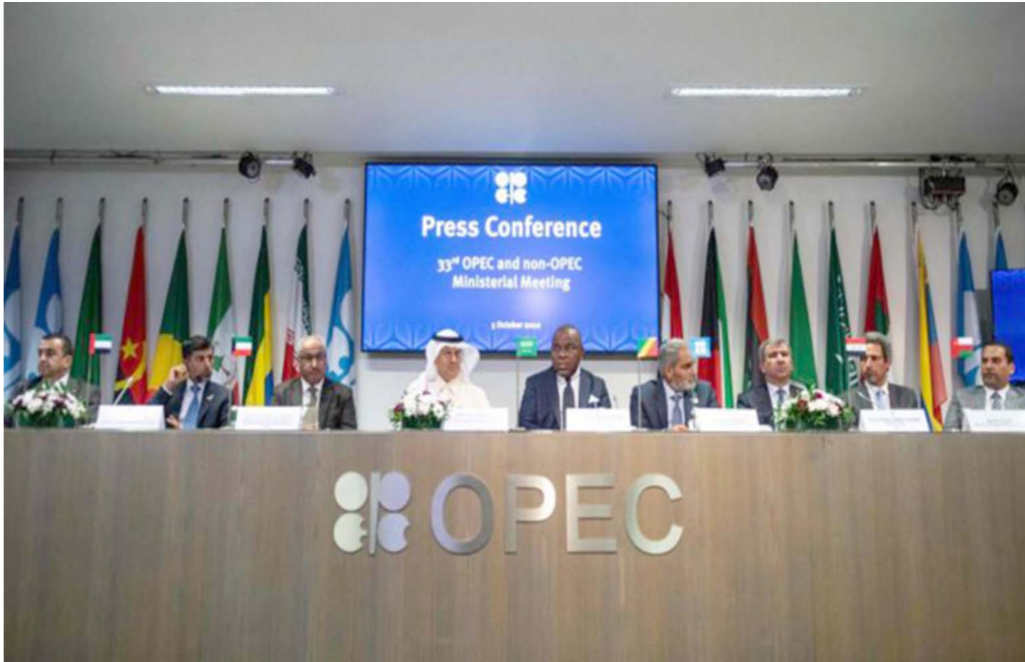
La OPEP mantiene sus compromisos en medio de los nuevos desafíos geopolíticos

La modificación en el cronograma de restauración gradual de la producción,