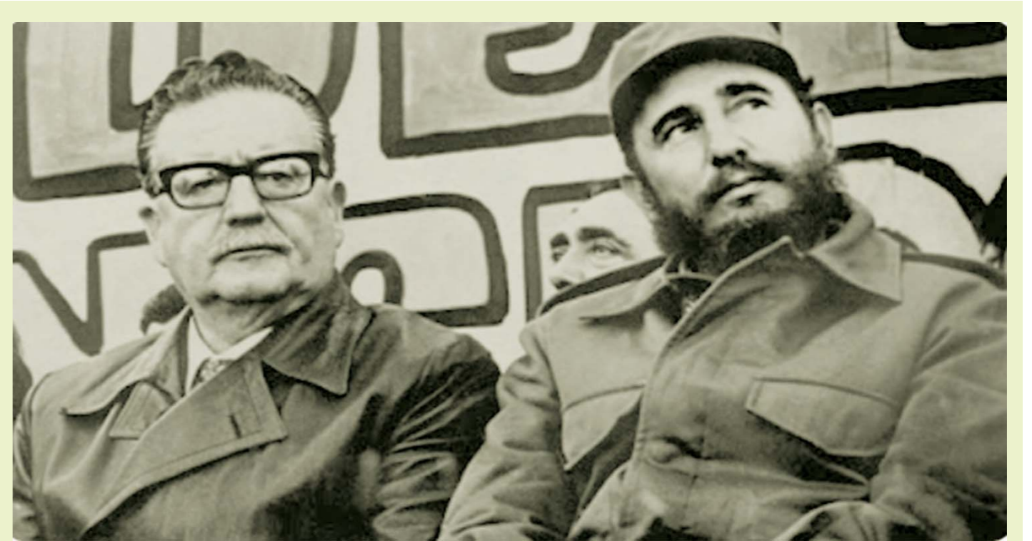
“Los hombres se parecen más a su tiempo que a sus padres”

En este escenario, tanto la OPEP+ como Washington se mueven con cautela. Para el bloque exportador, el desafío es mantener el equilibrio entre sus propios intereses y las exigencias externas. Para Trump, el reto es evitar que su propio programa de sanciones y aranceles termine socavando la estabilidad de los precios que tanto busca garantizar.