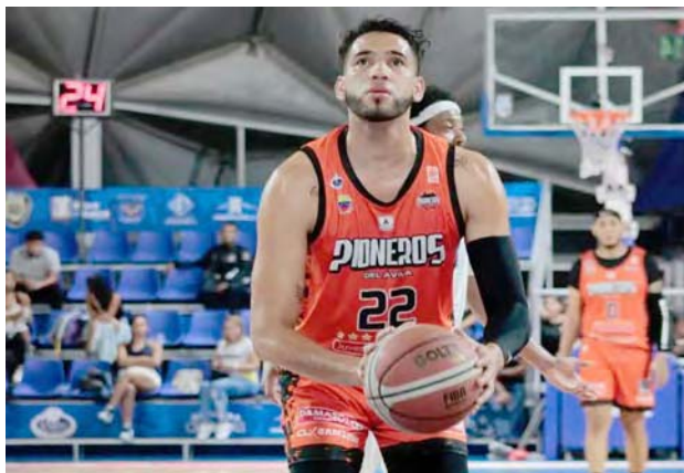
Montaña tiene 33 años en la actualidad

Ahora estará con el equipo avileño desde el principio tras ser cedido nuevamente por Spartans. “Será un gran reto, voy mentalizado a mejorar los