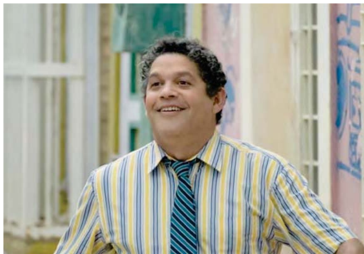
El actor con ancestros italianos, protagonizó la cinta Venite pa Maracaibo en 2022