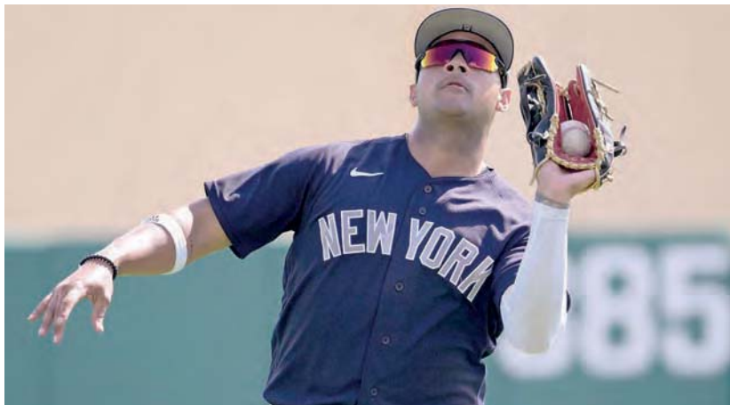
El guaro cumplirá 24 años el 10 de abril

Entrevistado en estos días, Boone ya definió que sus primeros cuatro jardineros, que serán el recién adquirido Cody Bellinger en el centro, Jasson “El Marciano” Domínguez en el jardín izquierdo y, indudable, Aaron Judge en el derecho, con Trent Grisham como buena opción