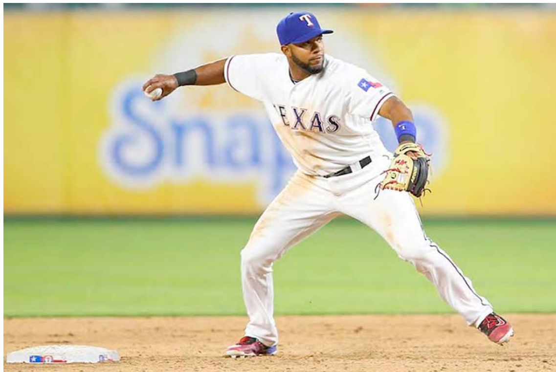
A los 20 años debutó con Texas en Grandes Ligas

El bateador derecho registró línea ofensiva de .269/.325/.370 (OPS de .695) con 102 jonrones, 775 impulsadas y 347 bases robadas en 2.059 juegos. En este siglo (2000-24), los 1.966 juegos de