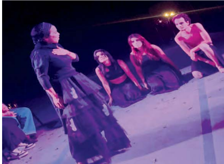
Con estas funciones celebran los 40 años de Teatrela y Aedos Colectivo de Canto Popular

El concepto original de Costa Palamides toma como base los ensayos del poeta español, en los que desarrolla la idea del