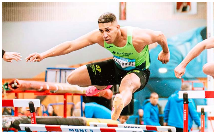
A los 29 años sigue mejorando sus registros

También fue primero en la pértiga con 4.81 metros. En el salto de longitud fue cuarto con 6.93 metros y en el lanzamiento de bala se ubicó en la tercera casilla con 14.38 metros.