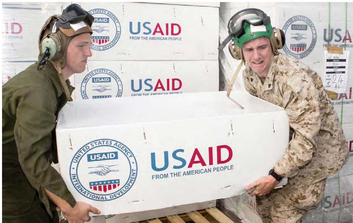
Creada en 1961, la USAID es una destacada organización en la planificación de cambios de régimen y golpes de Estado

Estados Unidos inundó de subvenciones a la sociedad civil ucraniana en vísperas del golpe de Estado del Maidán de 2014, dando a luz a una red de medios de comunicación pro-occidentales casi de la noche a la mañana. Entre ellos se encontraba Hromadske, una entidad de radio-difusión liberal que promovió