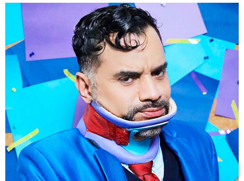
El intérprete vuelve a mostrar su versatilidad e esta pieza

El actor agregó que, en su opinión, el poder siempre va a corromper a las personas más débiles. “Cuando una persona que tiene este status de poder entiende que el autocontrol es la principal herramienta para tener poder, ahí comienza a cambiar definitivamente el panorama sobre todas las cosas.