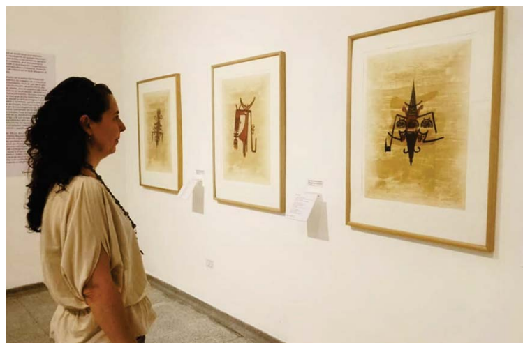
Realizaron un cine foro para profundizar en el legado de este creador