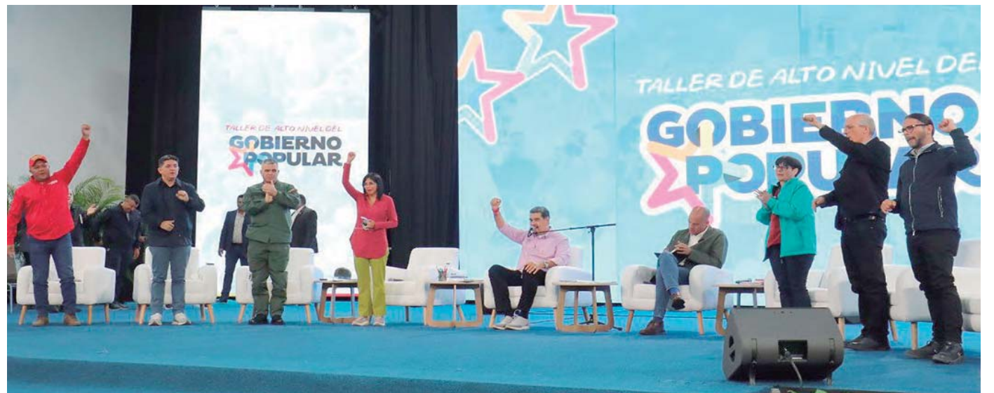
págs. 2 y 4

Dio instrucciones muy precisas sobre los equipos de trabajo y sus funciones destacando la importancia de contar con las salas de autogobierno popular, como ordenó se denomine a esas instancias como espacios para construir un futuro próspero para Venezuela y concentrarse en lo fundamental: “dejar el pellejo por el bienestar del pueblo”.