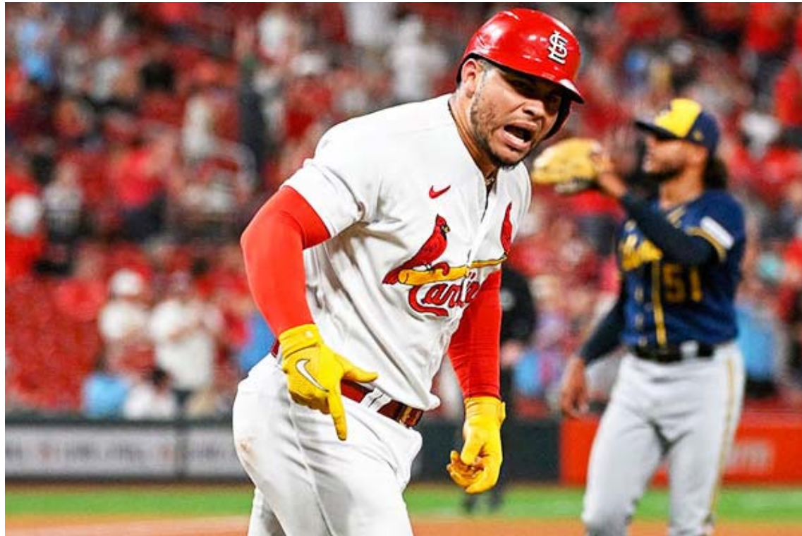
El mayor de los Contreras es considerado un buen bate

El bateador derecho antes acostumbraba a llegar a los