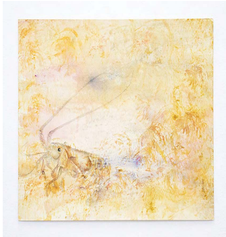
El corpus de la exhibición estopa compuesto por 50 piezas

Según explica el curador de la muestra Luis Romero en el texto de sala: "A pesar de su supuesta cualidad anacrónica