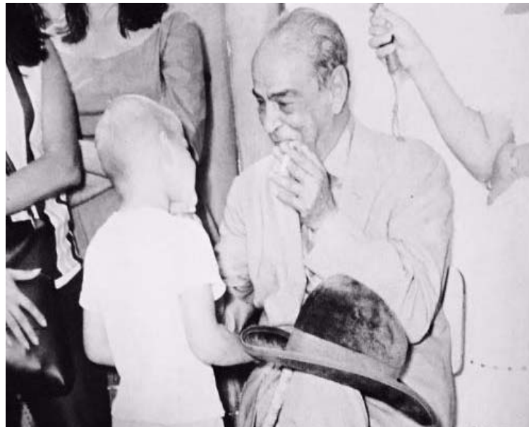
Un anciano Rómulo Gallegos visita Apure

En Apure, un numeroso grupo de personas se organiza y propone el nombre de Gallegos como candidato a la Presidencia de la República. Elaboran un documento el 5 de febrero de 1941, publicado el día 11 del mismo mes en el diario caraqueño AHORA . Allí se dice: “En la vida pública venezolana como fieles a una consigna que es letra del Himno mismo de la Nación, la provincia esperó siempre la iniciativa incubada y surgida en la Capital de la República para sumarse a ella. Sin embargo, toca hoy a los pueblos apureños romper esta tradición sin que ella quiera verse un pueril afán, sino más bien como un estímulo al conglomerado capitalino, que parece adormecido, o indiferente, o precavido, ante uno de los acontecimientos de mayor trascendencia para el porvenir de