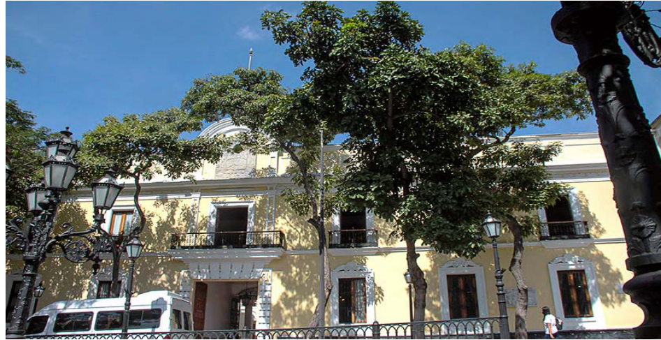
En el comunicado el Gobierno denuncia la manipulación de organizaciones criminales con fines políticos

El Gobierno venezolano en el comunicado informó que, a través del Plan Vuelta a la Patria, solicitó la repatriación de un grupo de connacionales que fueron llevados injustamente a la base naval de Guantánamo, requerimiento que fue aceptado y los ciudadanos han sido trasladados a Honduras, donde serán recuperados por aviones de Conviasa y traídos de regreso para reunirse con sus familiares