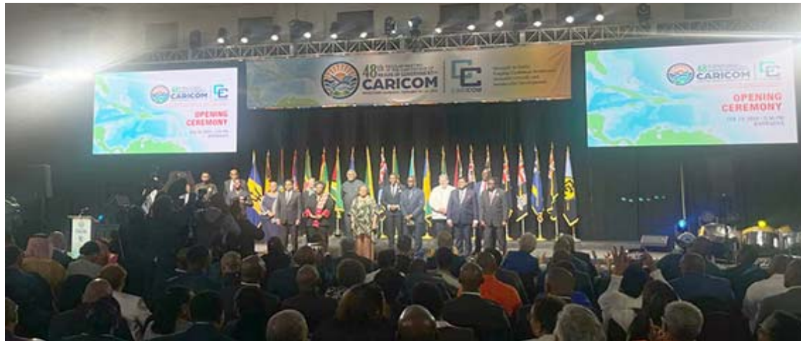
La 48 Reunión se celebró en Barbados, país que asumió la Presidencia Pro Tempore del organismo

Con su participación en este foro, el Gobierno Bolivariano reafirmó el compromiso con la integración regional, compartió información sobre avances en áreas prioritarias y presentó las oportunidades que ofrecen los 13 nuevos motores productivos de la economía venezolana para el desarrollo conjunto