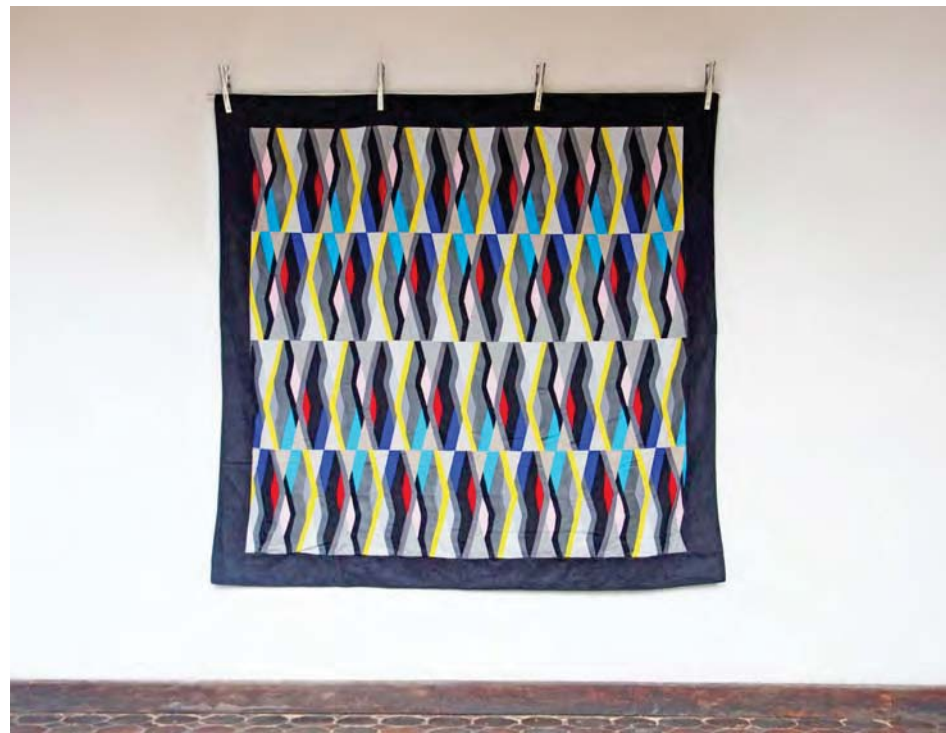
Los trabajos son de gran belleza y calidad