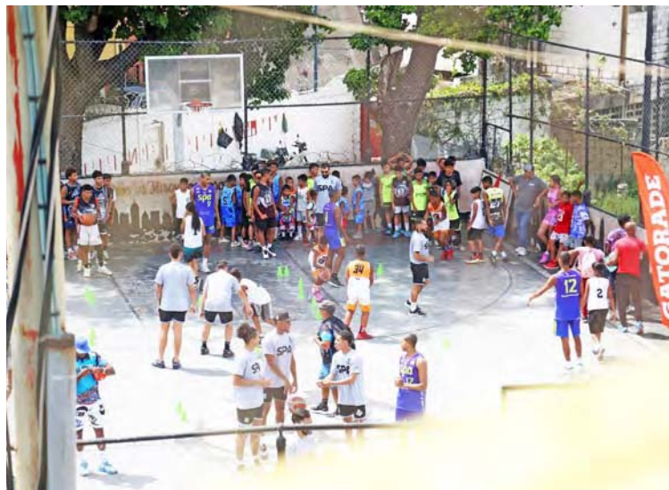
Jugadores y técnicos se fajaron para dar una buena clínica deportiva