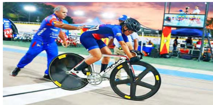
Los atletas tienen ahora una instalación digna