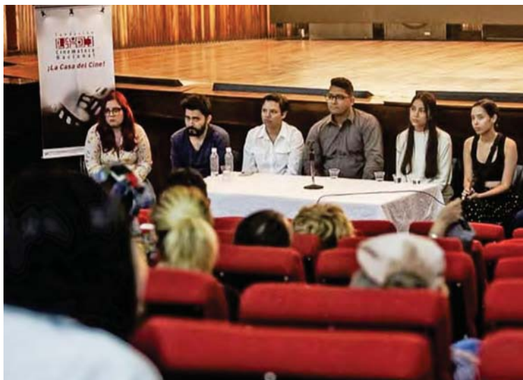
La Cinemateca le abre las puertas al talento estudiantil