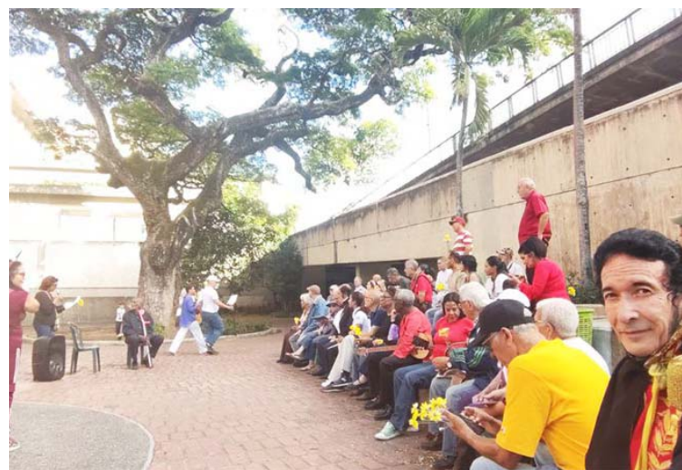
Durante la actividad habrá un evento vinculado a las artes plásticas para los más pequeños

De acuerdo con una nota de prensa, está prevista la participación de diversas agrupaciones culturales, literarias y de cantautores, además de una actividad de pintura libre para