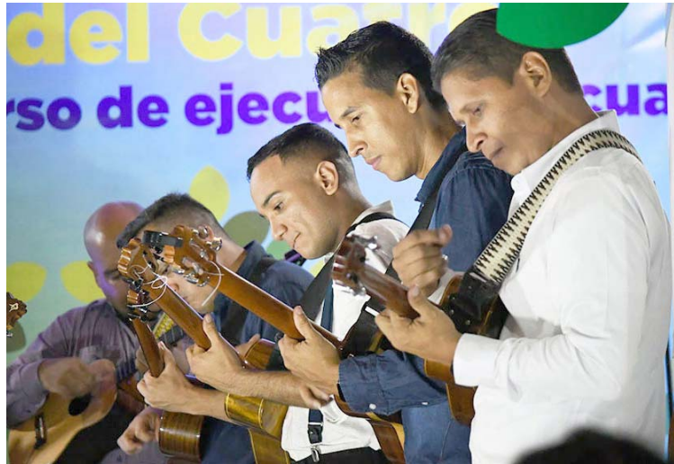
Unas 50 interpretaciones fueron evaluadas en la etapa eliminatoria

Para el sábado 5 de abril, estaba prevista la participación de