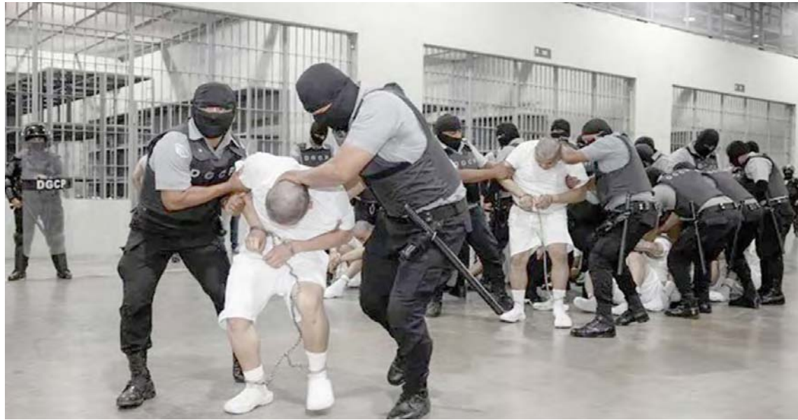
Estos actos evocan la persecución sufrida por el pueblo judío bajo el régimen nazi de Adolfo Hitler, recordó el presidente Maduro a directivos de la ONU

El Jefe de Estado solicitó la liberación inmediata y sin condiciones de los 238 venezolanos detenidos injustamente en los campos de concentración de El Salvador